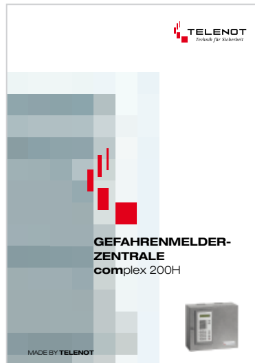
Prospekt „complex 200H“