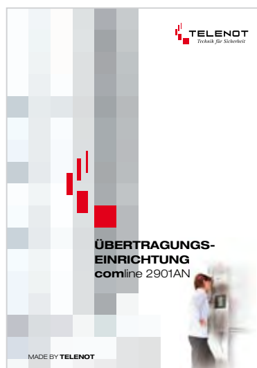
Prospekt „comline 2901AN“