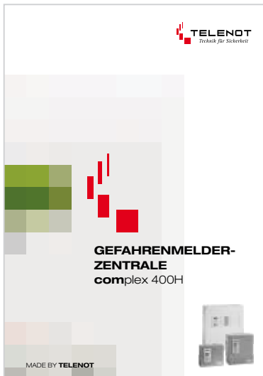
Prospekt „complex 400H“