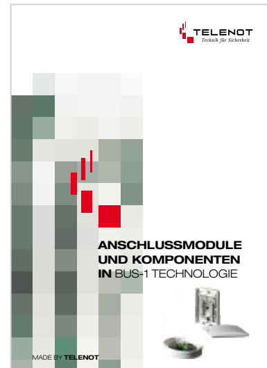
Prospekt „BUS-1 Module“